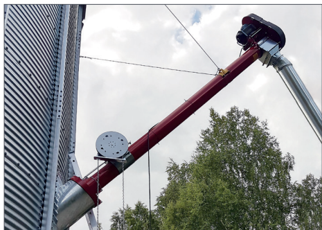
Trosstoed / Kaugjuhtimisega reguleeritav etteande kiirus