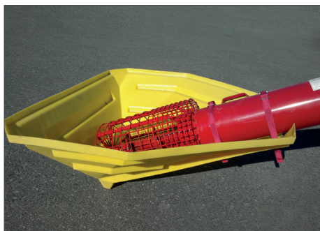
Kon i polymermateriale