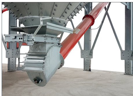
Innløp med 5° spalter / Glidespjeld