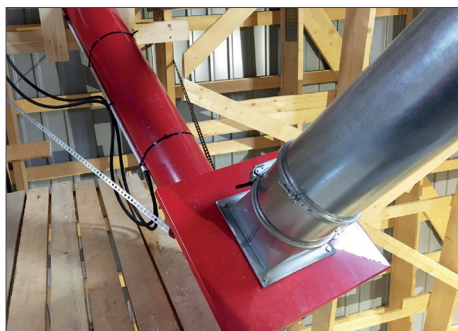
Tippficka / 160/200mm rörkoppling till tippfickan