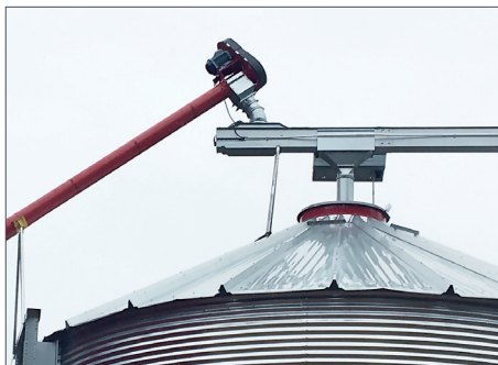
200/250mm rörkoppling till avlastningsändan